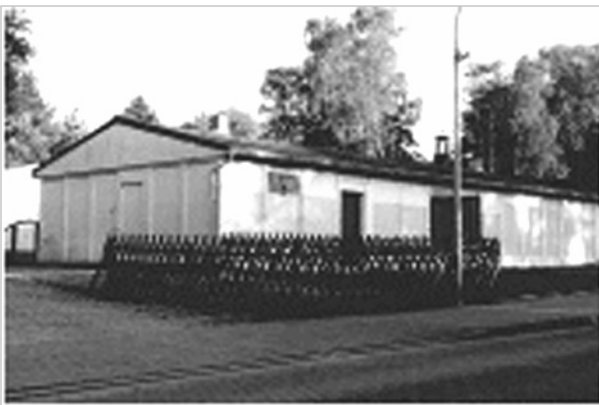
Originalbaracke des ehemaligen OAL im heutigen Zustand in Schwanewede

Das Lager wurde 1943 gebaut und befand sich zwischen Heidkamp im Osten, Molkereiweg im Norden, Hannoversche Straße im Westen und Hospitalstraße im Süden und bestand aus ca. 44 Baracken. Anfangs wurden hier überwiegend ukrainische Arbeiter untergebracht. 23 Die Gebäude und Baracken sind 1943 erstellt worden. 1944 wurden auch